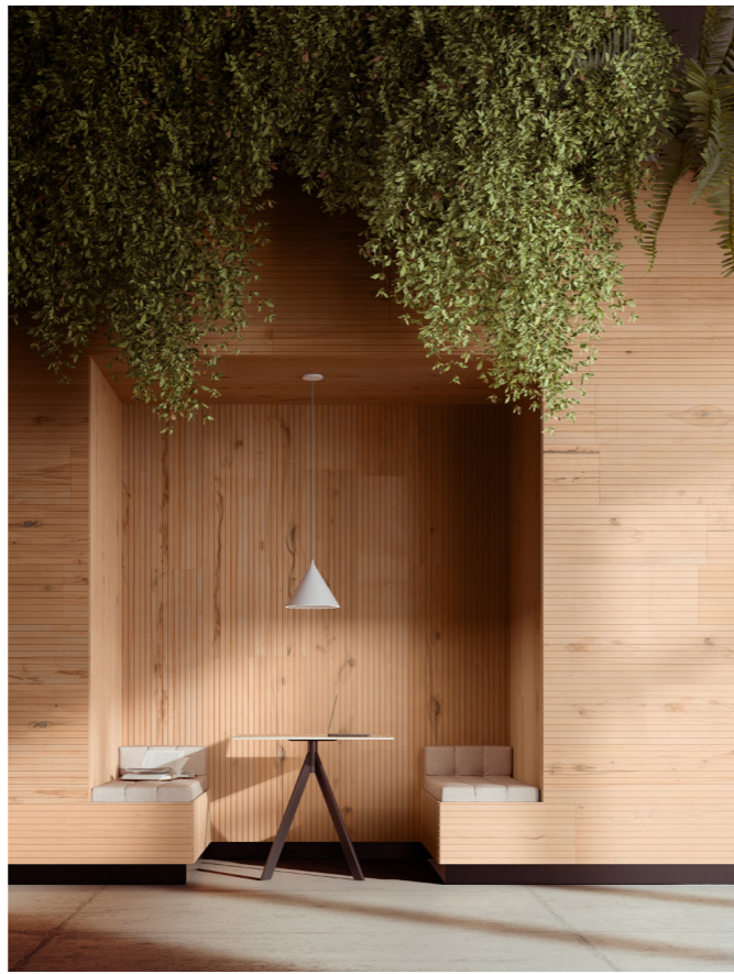
Rivestimento / Cladding Top Comfort Faggio/Beech tree H088 La Fenice