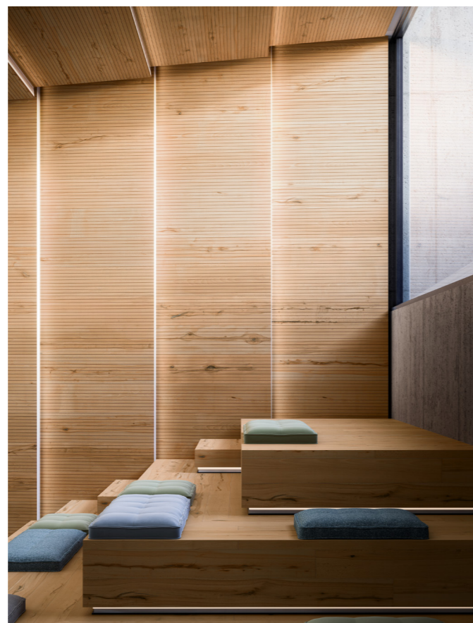
Rivestimento / Cladding Top Comfort Faggio/Beech tree H088 La Fenice