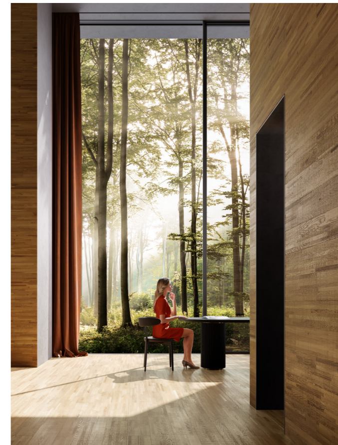
A project, but above all a method for processing wood according to the principles of a sustainable circular economy