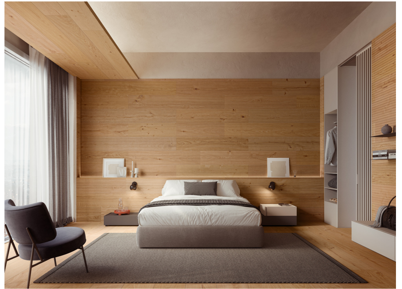
Pavimento / floor Tavole del Piave Rovere / Oak H073 Murano