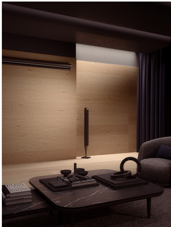
Pavimento / floor Tavole del Piave Rovere / Oak H073 Murano