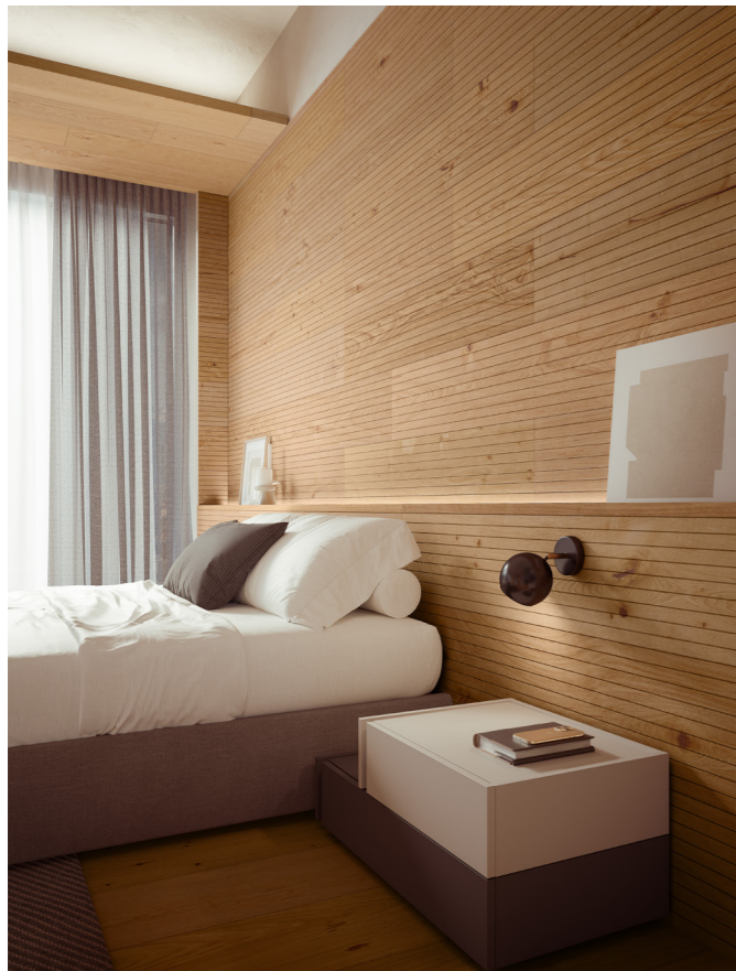
Pavimento / floor Tavole del Piave Rovere / Oak H073 Murano