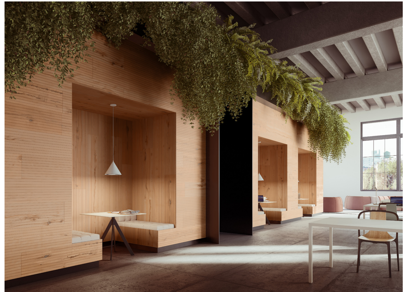
Rivestimento / Cladding Top Comfort Faggio/Beech tree H088 La Fenice