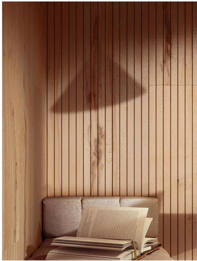
Rivestimento / Cladding Top Comfort Faggio/Beech tree H088 La Fenice