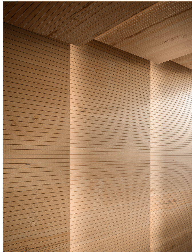
Rivestimento / Cladding Top Comfort Faggio/Beech tree H088 La Fenice