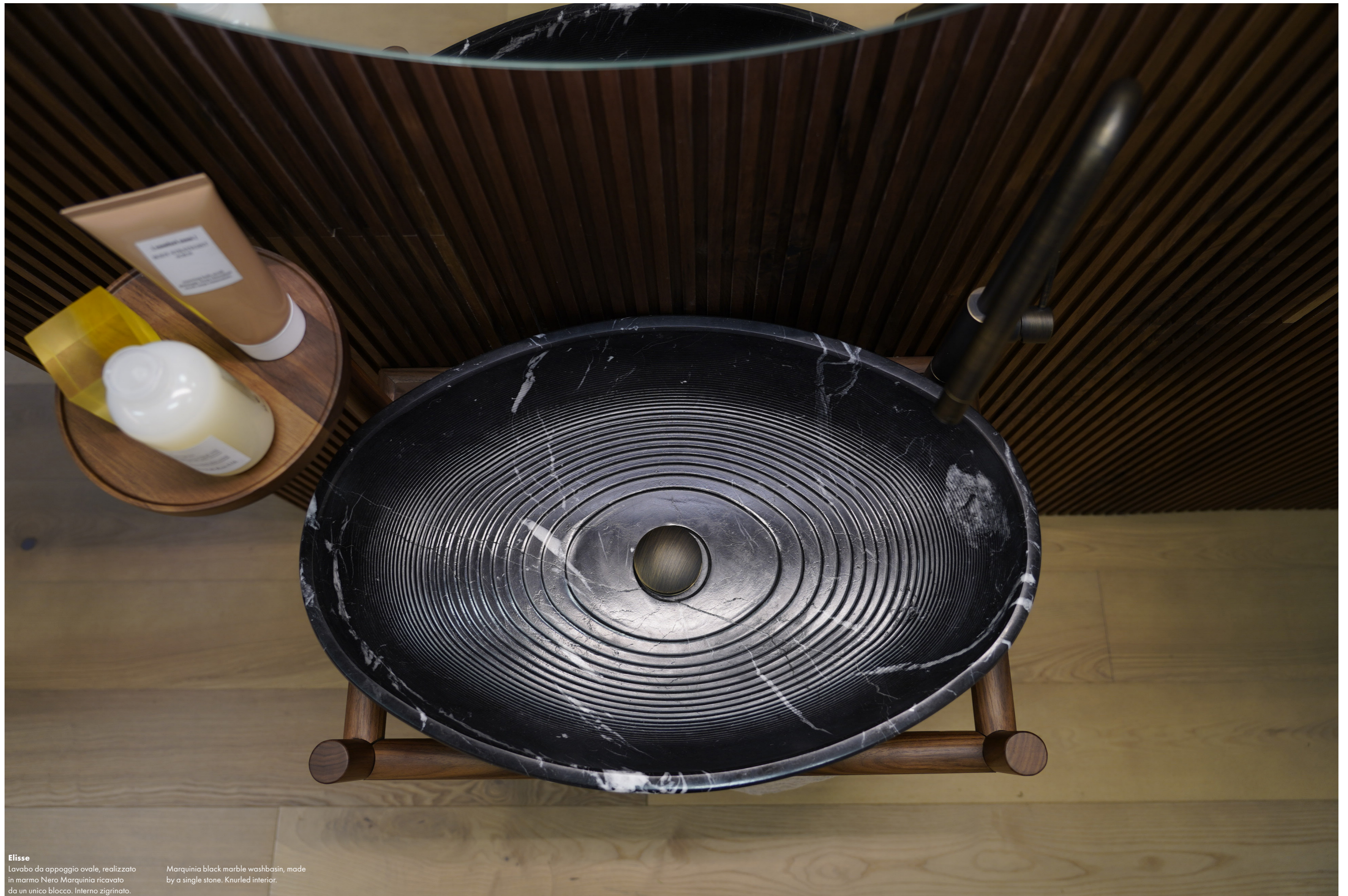
Elisse Lavabo da appoggio ovale, realizzato in marmo Nero Marquinia ricavato da un unico blocco. Interno zigrinato.