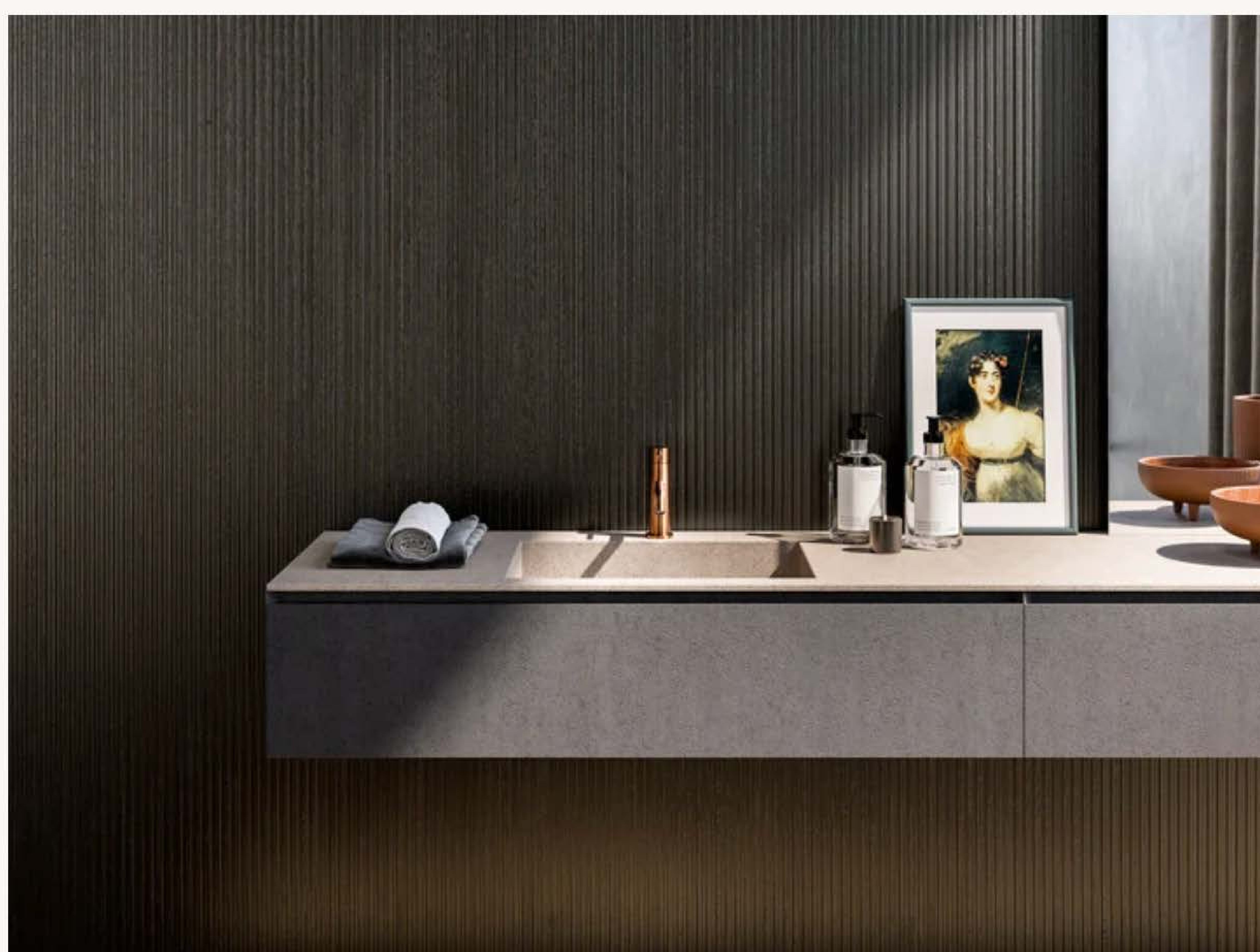
Mobile in laminam finitura Pietra Savoia Antracite. Boiserie in legno Le Righe Finline, Rovere Dark

Pezzi unici e sostenibili danno vita oggi alle novità della collezione Progetto Bagno Itlas presentate in occasione del Cersaie 2023 : mobili eclettici e boiserie tridimensionali si abbinano a pavimenti materici dalla forte impronta naturale.