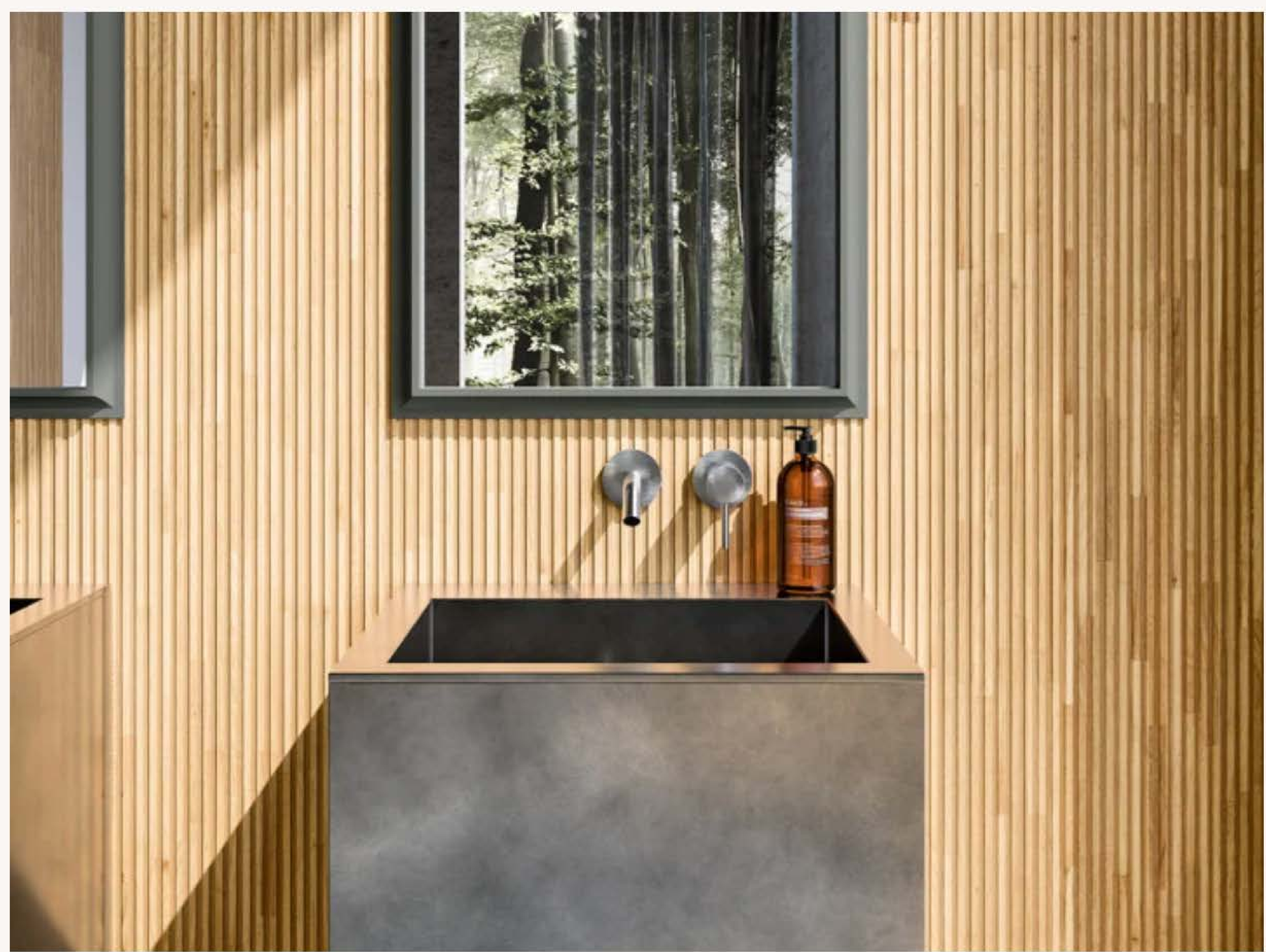
Boiserie in Legno collezione Ecos, Le Righe Finline, Rovere Blond

Isola Light è un mobile contenitore regolabile in alluminio anodizzato e vetro (trasparente oppure fumé), rivestito di legno completamente modulabile. Il top è personalizzabile: può essere realizzato in marmo, gres o in sintetico.