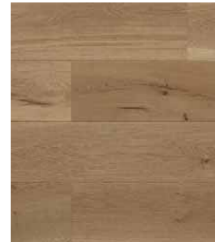
Rovere/oak C012 Canapa