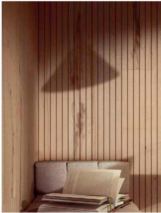
Rivestimento / Cladding Top Comfort Faggio/Beech tree H088 La Fenice