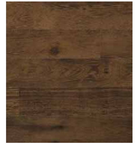
Rovere/oak C022 Terra Umbra

Una delle novità firmate ITLAS nel campo dei pavimenti prefiniti in legno è Doghe Venezia Giulia , listone a due strati che conserva nel tempo la qualità, l'eleganza e la naturalezza. Composto dall'essenza nobile in legno massiccio di rovere e da un supporto in abete con incastri calibrati maschio-femmina sui quattro lati, è disponibile in tre formati. Un pavimento stabile, preciso, tecnologico, resistente e sicuro.