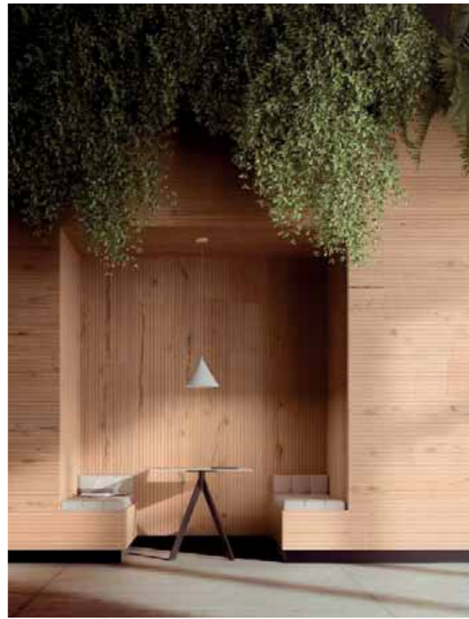
Rivestimento / Cladding Top Comfort Faggio/Beech tree H088 La Fenice