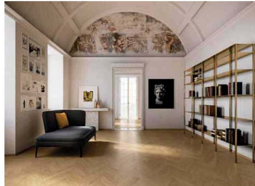
IGC Spina Ungherese chiusa Rovere/Oak Natura Y017