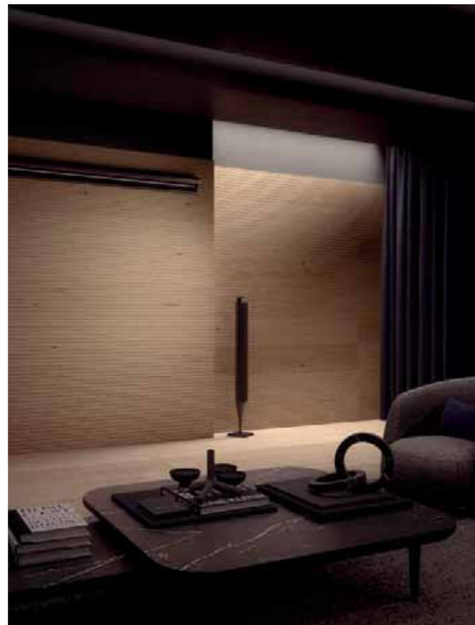
Pavimento / floor Tavole del Piave Rovere / Oak H073 Murano