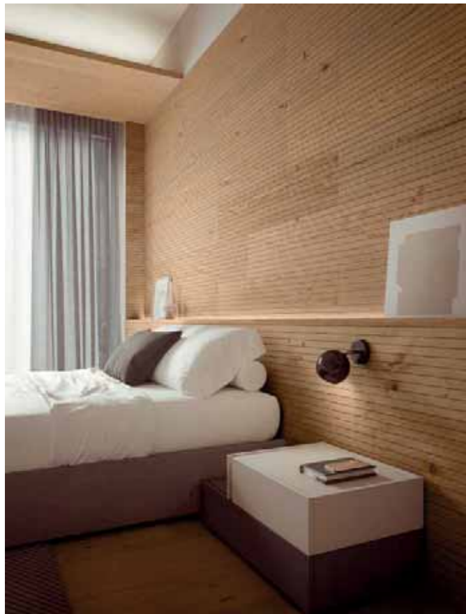
Pavimento / floor Tavole del Piave Rovere / Oak H073 Murano