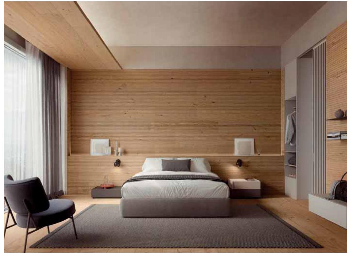
Pavimento / floor Tavole del Piave Rovere / Oak H073 Murano