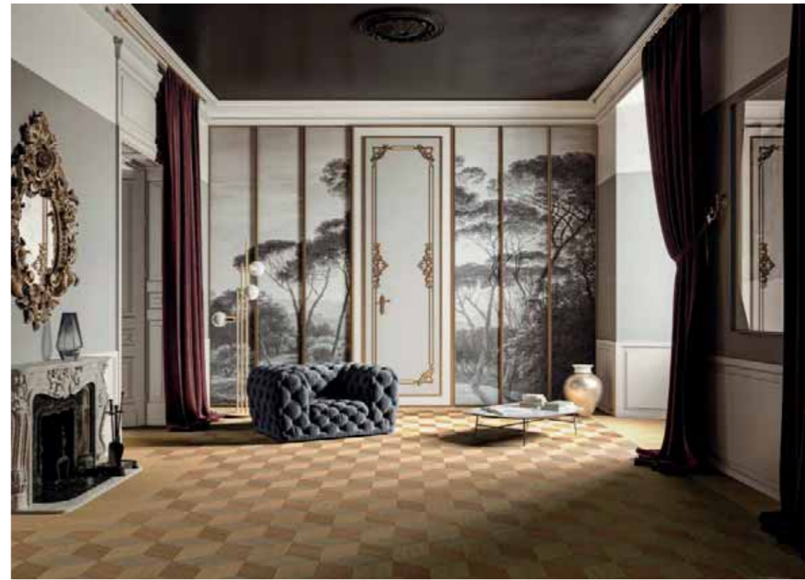
IGC 309 Rovere/Oak City C078 Mocaccino C098, Natura Y015