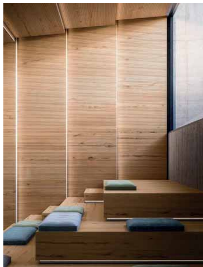
Rivestimento / Cladding Top Comfort Faggio/Beech tree H088 La Fenice