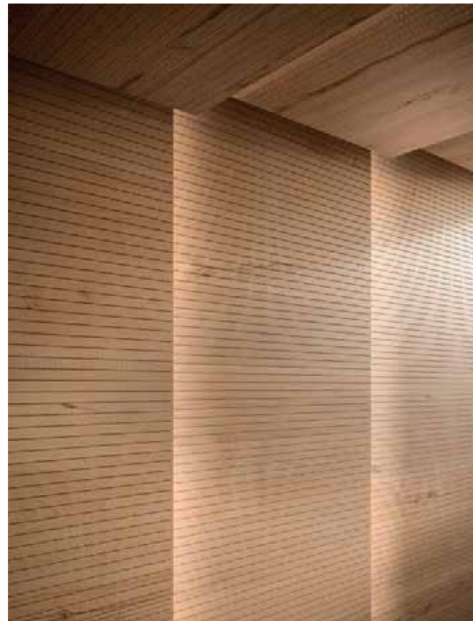
Rivestimento / Cladding Top Comfort Faggio/Beech tree H088 La Fenice