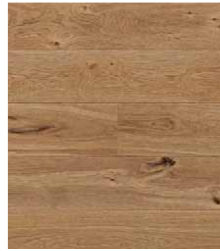
Rovere/oak Y026 Naturale