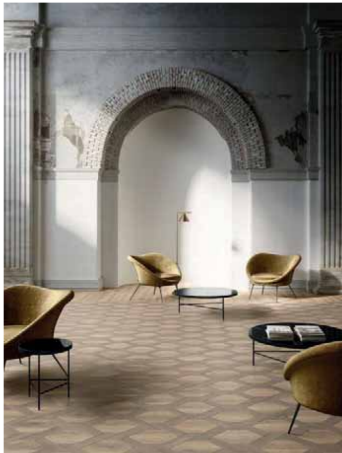
IGC 300 Rovere/Oak Bianco Provenzale C093, Veneziano C094