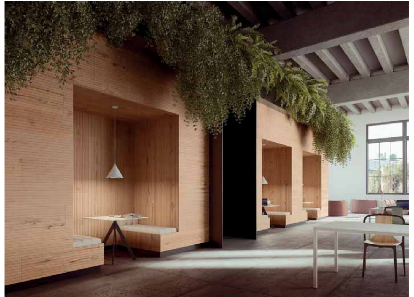
Rivestimento / Cladding Top Comfort Faggio/Beech tree H088 La Fenice