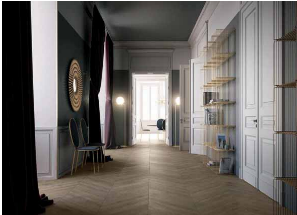
IGC Spina Ungherese Rovere/Oak Veneziano C094