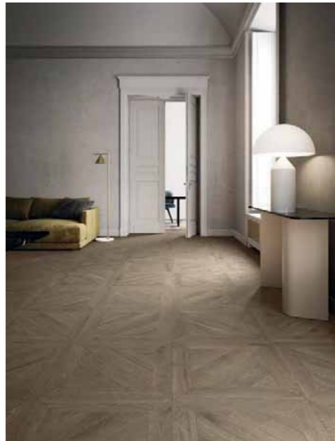
IGC 227 Rovere/Oak Veneziano C094