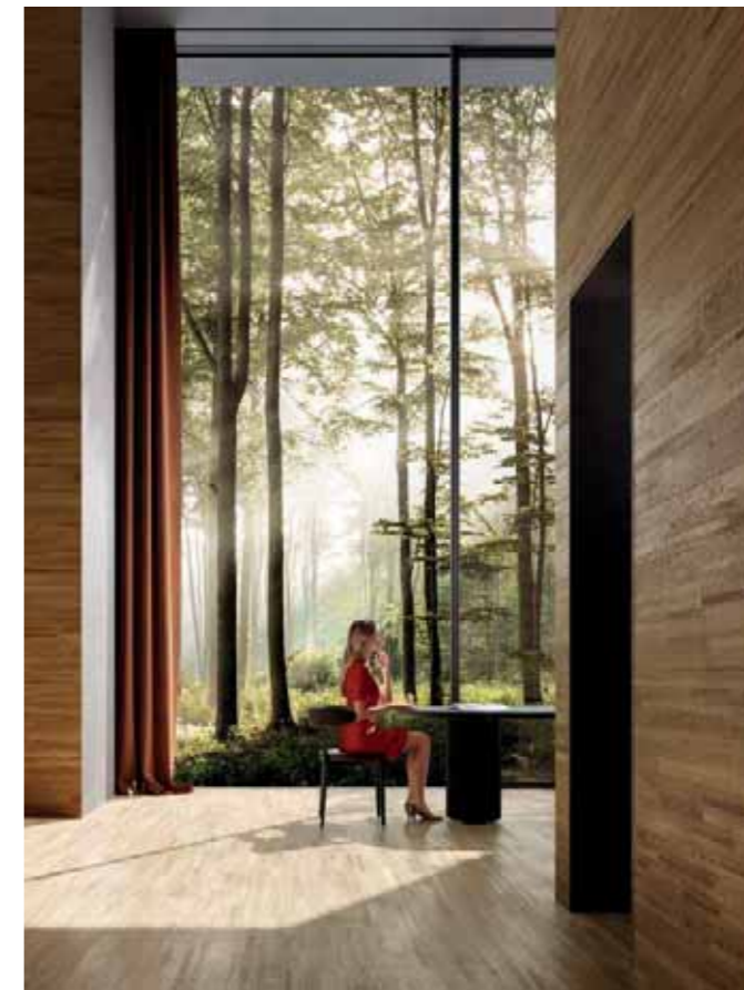
A project, but above all a method for processing wood according to the principles of a sustainable circular economy