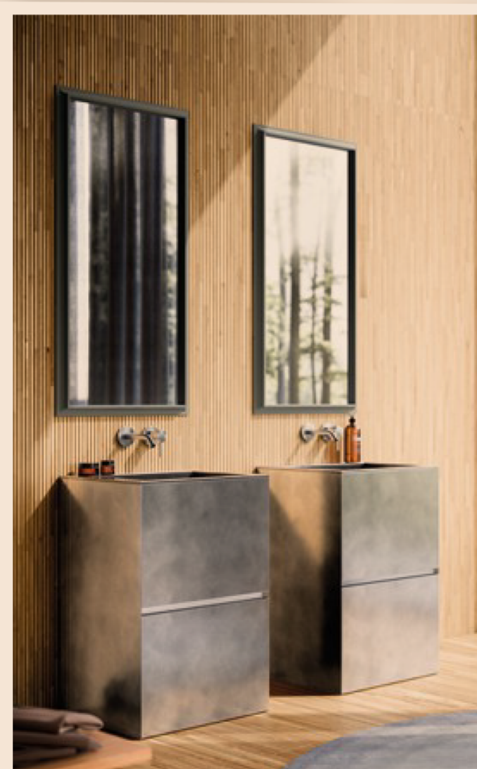
a destra, Le Righe di Itlas