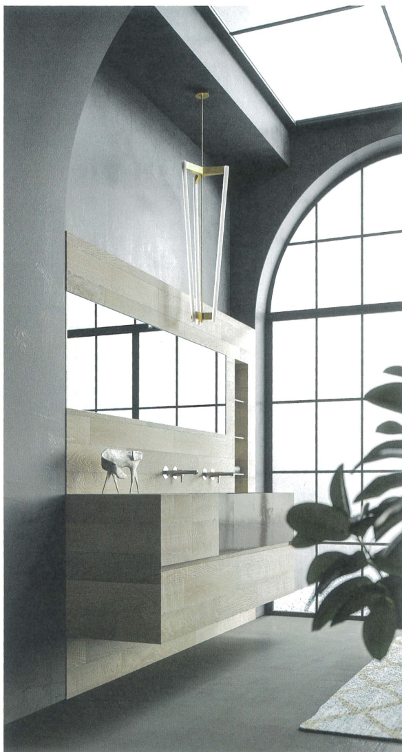
Sopra, la collezione Capri by Archea Associati, del Progetto Bagno 5 Millimetri, diventa elemento centrale di soluzioni ideate per il bagno rivestendo la parete della zona lavabi. A destra, il parquet della linea Tavole del Piave.