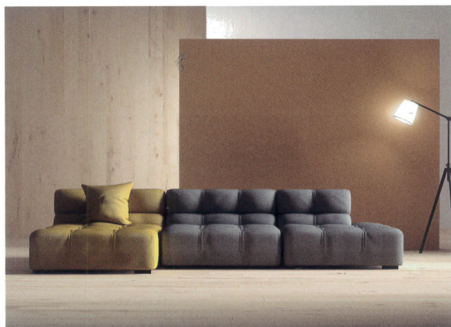
Assi del Consiglio, R&D Itlas, 2009

The current time of great uncertainty resulting from the international Covid-19 epidemic is driving final customers towards more conscious, environmental choices. Wood is definitely one of the raw materials best representing this concept of living, and so our company offers the ideal response to this demand on the market.