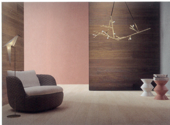
LeRighe, R&D Itlas, 2020