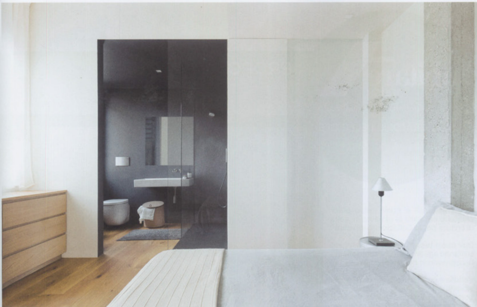
Camera padronale in un'immersione di bianco che apre l'accesso al bagno privato dotato di una grande doccia a filo pavimento completamente in resina color antracite. Comodino Kartell e lampada da tavolo Gira by Santa & Cole. Rivestimento pareti bagno Nord Resine, tinta custom su campione. Rubinetteria e soffione Cea Design, lavabo Kartell by Laufen, cesto Basket di Agape, vaso Fast di Pozzi Ginori.