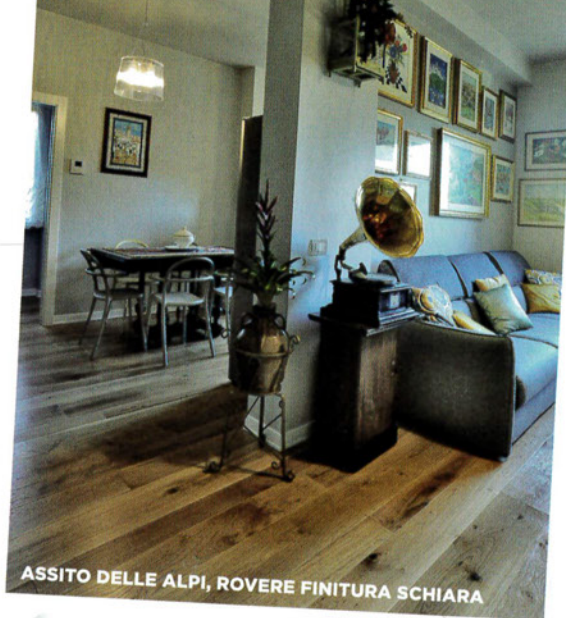
ASSITO DELLE ALPI, ROVERE FINITURA SCHIARA

La collezione Assito delle Alpi rappresenta il vero archetipo di stile in produzione artigianale, un prodotto perfetto risultato di grandi maestri di Utles e di spaccato abitato alla prova in pavimenti scelti. Assito delle Alpi è composto da una strata di parquet legno massiccio scuro su un sottile strato di Betulla, un composito che garantisce stabilità e durata a prova sotto sforzo. Uno di questi ad essere il di natura completa la bellezza di un parquet moderno e stabile. Una leggerezza e leggerezza depositata in un'ottima offerta di prezzi per adeguare il pavimento alla vita della casa.