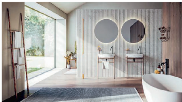
Faggio e marmo per la sala del relax Non solo pavimenti e rivestimenti: Itlas utilizza il legno anche per l'arredobagno. Come nella collezione Ellisse, dove il faggio della Foresta del Consiglio viene usato come sostegno al lavabo in marmo