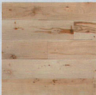
PARQUET in faggio La Serenissima, collezione Assi del Consiglio [Itas].

Il segreto è enfatizzare il contrasto naturale-artificiale: il legno è abbinato a piastrelle scure e microcemento.