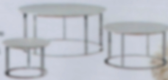
Tavolo in metallo e legno (Opacissimo), collezione Assi del Consiglio [Itas].