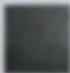
Microcemento 3D in Opacissimo, collezione Assi del Consiglio [Itas].