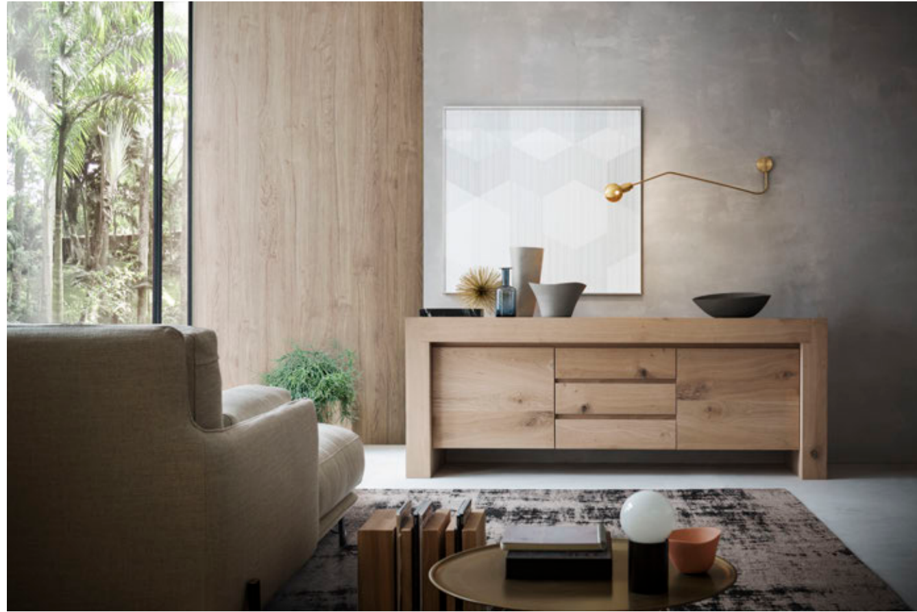
Elemento contenitore in rovere naturale disegnato da Adolfo Natalini in versione media.