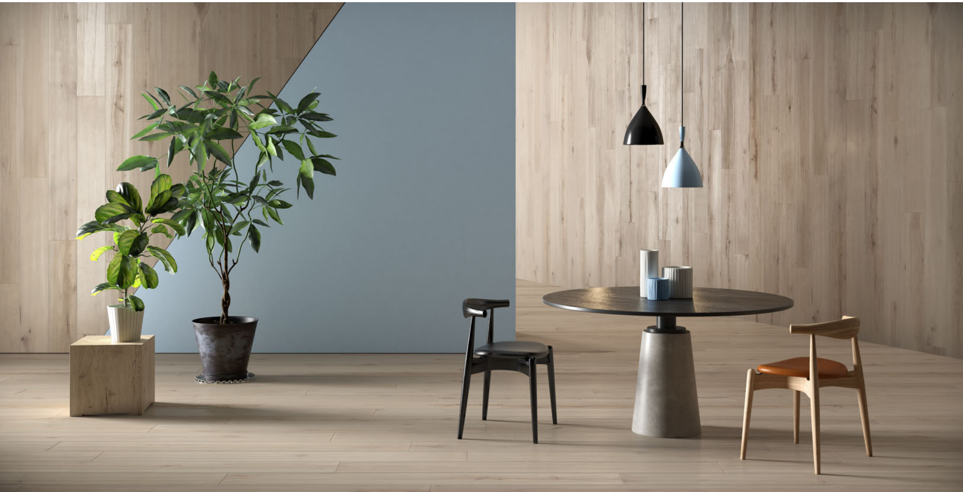
Assi del Consiglio faggio finitura piallato campiello Assi del Consiglio campiello planed finish beech