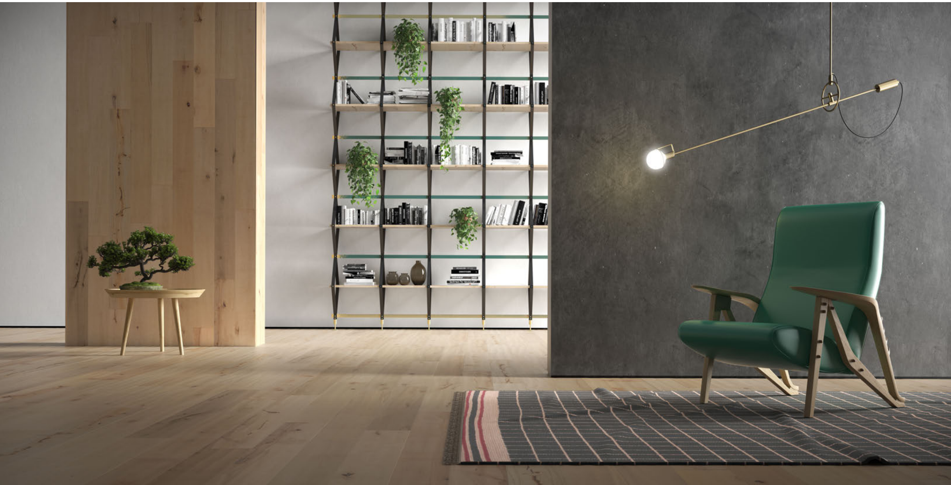
Assi del Consiglio faggio finitura piallato rialto Assi del Consiglio rialto planed finish beech