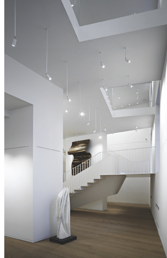
Total white e pavimentazione in Tavole del Piave di Itlas finitura rovere - collezione storica dell'azienda specializzata nella produzione di listoni prefiniti a tre strati di grandi dimensioni - per questo spazio dedicato all'arte, nel cuore del capoluogo toscano, in cui il candore lascia pieno spazio all'espressione delle singole opere.