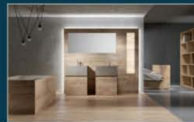
LE ORIGINALI SOLUZIONI PER L'ARREDOBAGNO.

Legni del Doge è un listone prefinito a due strati. Lo strato a vista è in legno nobile, disponibile in varie essenze e finiture. Con Legni del Doge Itlas ha creato un parquet pratico e veloce da posare, stabile e resistente. Un pavimento in legno prefinito a due strati che conserva nel tempo la qualità, l'eleganza e la naturalezza. Composto da essenza nobile in legno massiccio e supporto in multistrato di betulla con incastri calibrati maschio-femmina sui quattro lati. Disponibile in diversi formati, Legni del Doge è un pavimento stabile, ecologico, preciso, tecnologico, resistente e sicuro. È un prodotto adatto e consigliato per la posa su riscaldamento a pavimento.