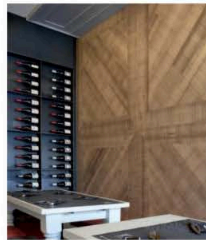
IN ALTO: FAGGIO LA FENICE DI ASSI DEL CONSIGLIO. SOPRA: FAGGIO CON FINITURA PERSONALIZZATA.

per il legno e dalla predilezione per il lavoro artigianale: un assito prestigioso con il quale Itlas ha riscoperto i pavimenti di un tempo, riproponendoli con lo stesso pregio e la stessa emozione. Lo strato a vista in legno nobile, la controfaccia di bilanciamento in legno massiccio di abete e l'anima centrale in compensato di betulla con minimo cinque strati posizionati in modo ortogonale agli altri strati danno equilibrio e stabilità estremi.