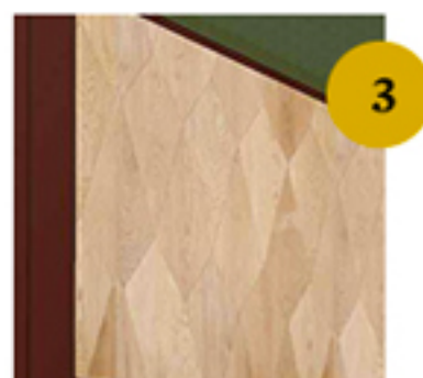
Elementi in legno Itlas