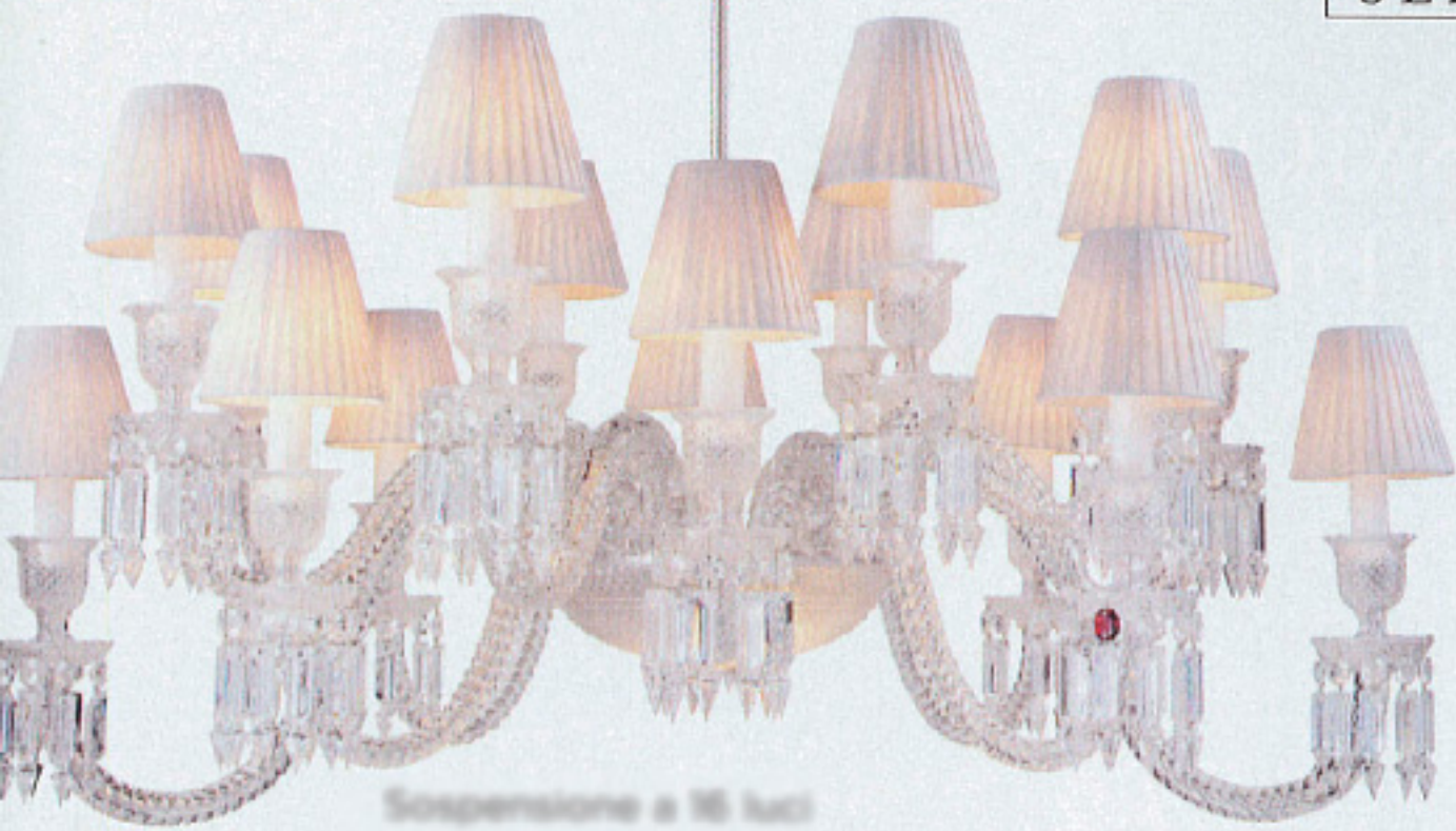
Sospensione a 16 luci Eliosa, design Arlo Levy per Baccarat, a destra, porta Tratto, coll. Replica, da cm 175 a 240, Pomeroy&Co.