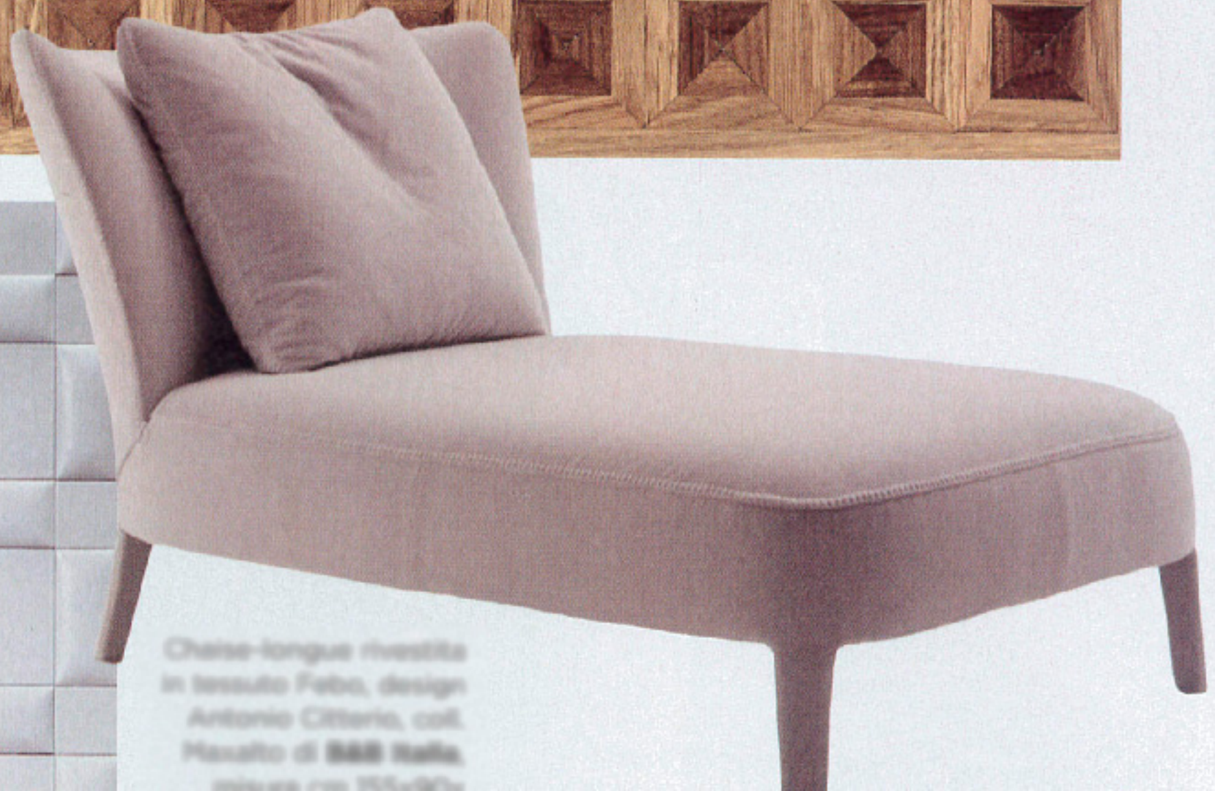
Chaise-longue rivestita in tessuto Felo, design Antonio Citterio, coll. Mozzato di B&B Italia, altezza cm 105-107