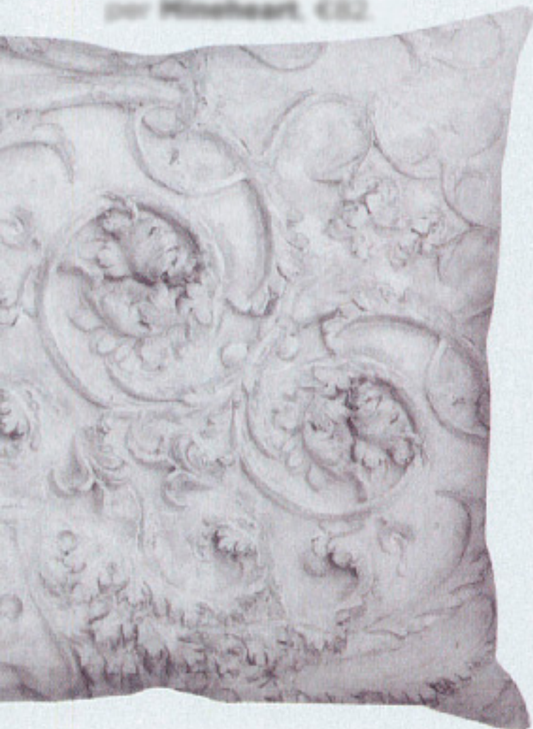
Ispirato ai decori del XVIII sec., cuscino in puro cotone Stone Heart Grey, design Young & Bittaglia per Minchietti, €52.