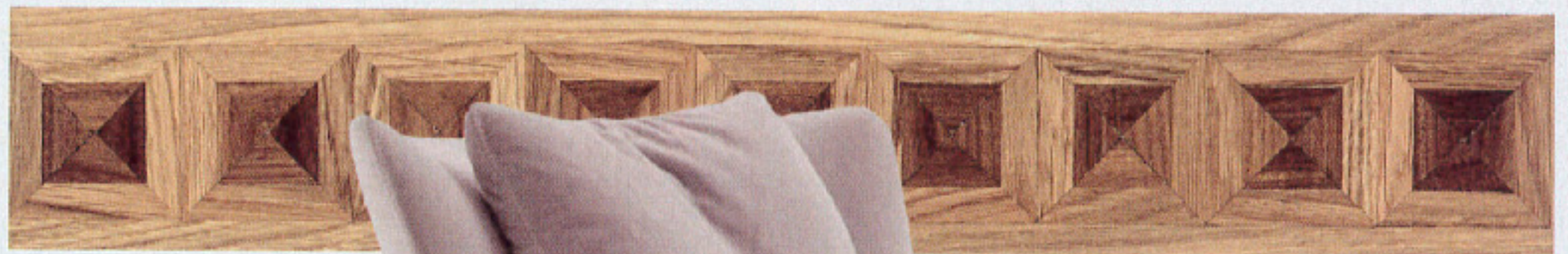
A destra, cornice décor per parquet Diamond, in massello prefinito, di M&P Pergamo, sotto rivestimento in pelle Pearl White, Minchietti