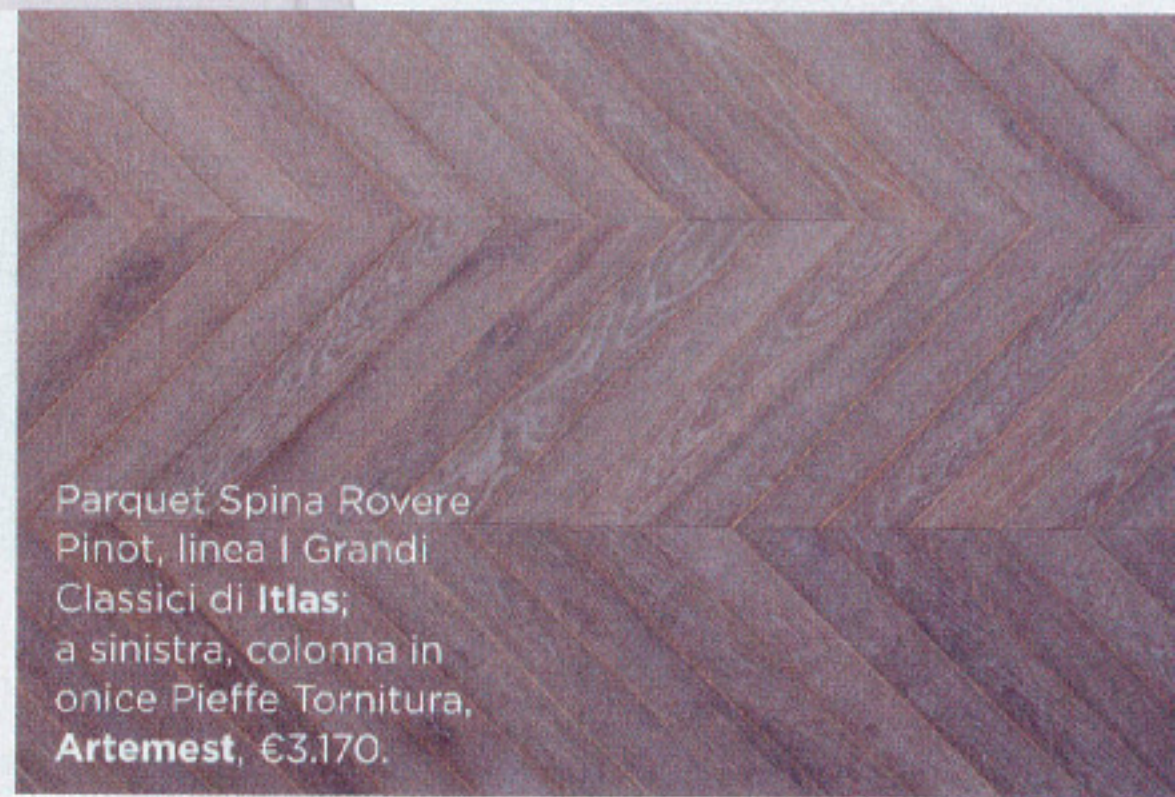
Parquet Spina Rovere Pinot, linea I Grandi Classici di Itlas; a sinistra, colonna in onice Pieffe Tornitura, Artemest, €3.170.