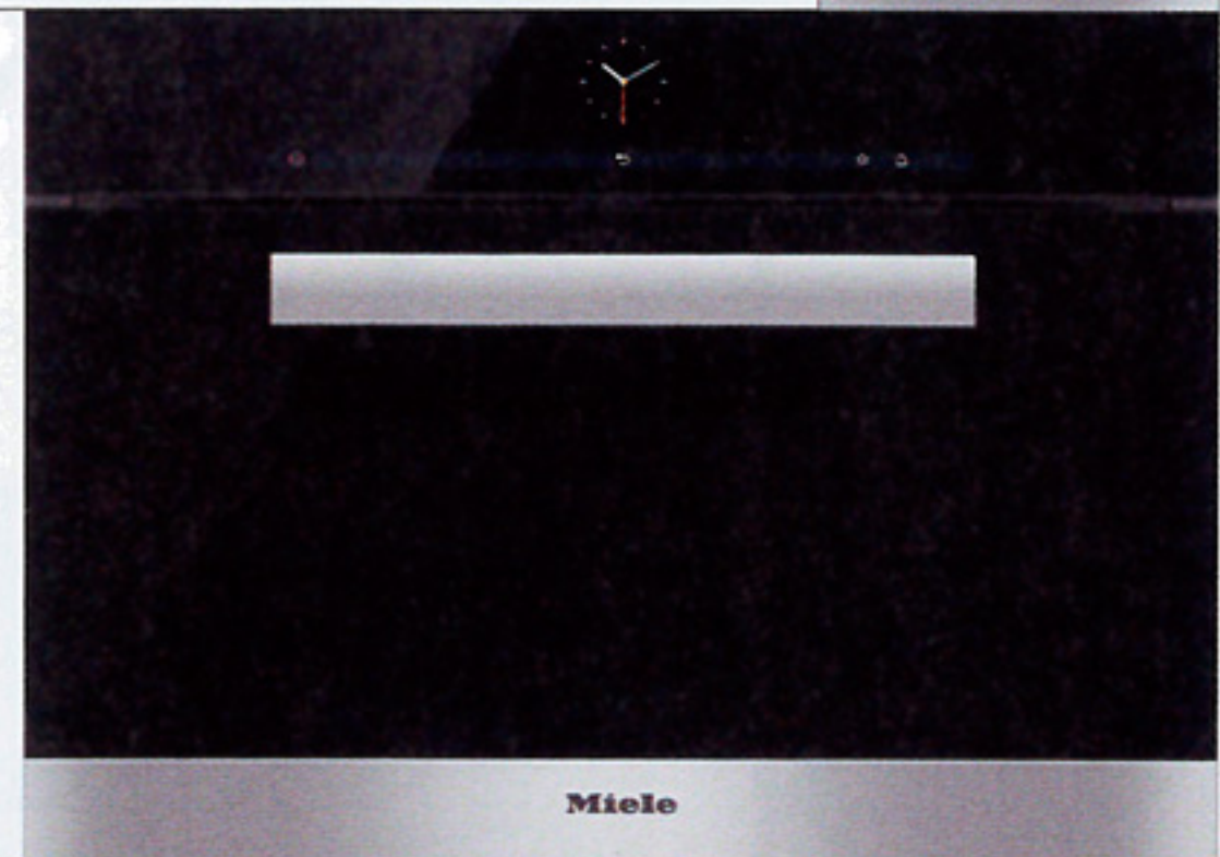
Forno a vapore da incasso DG 6200, con display e tasti integrati, Miele , cm 59,5x57x45,6h, €1.708.