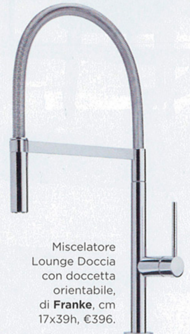
Miscelatore Lounge Doccia con doccetta orientabile, di Franke , cm 17x39h, €396.