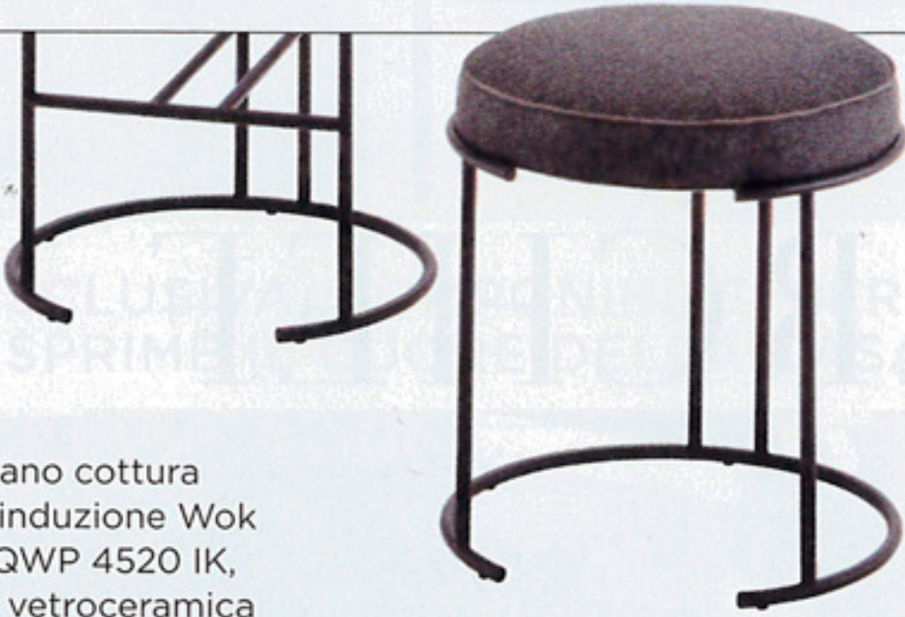
Piano cottura a induzione Wok EQWP 4520 IK, in vitroceramica nera, Electrolux , incasso cm 52x36.

FORME RAZIONALI ED ERGONOMICHE. PER UNA LEGGEREZZA ESTETICA CHE AMPLIFICA I VOLUMI ED ESALTA LA TECNOLOGIA