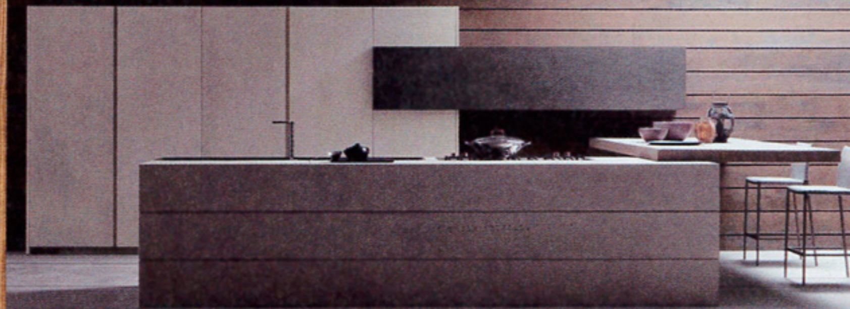
Cucina Twenty, penisola in legno ad alto spessore, basi e top in resina grigio cemento, di Modulnova .