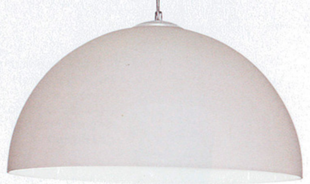
Sospensione Cloè, in vetro soffiato bianco lucido e struttura in nichel satinato, Penta , cm 50Øx25h, €366.

FORME RAZIONALI ED ERGONOMICHE. PER UNA LEGGEREZZA ESTETICA CHE AMPLIFICA I VOLUMI ED ESALTA LA TECNOLOGIA