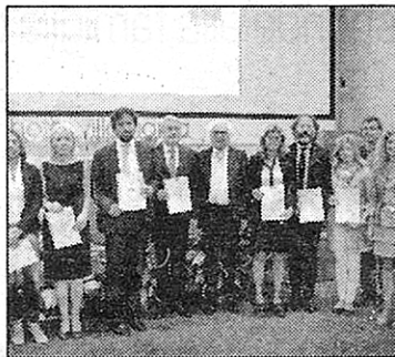
AUDIT Le aziende venete premiate

vizi integrati ambientali) di Marcon (Venezia). «Si tratta di procedimento organizzativo molto diffuso in Germania - ha detto l'assessore regionale Remo Sernagiotto - che consente ai datori di lavoro di dialogare con i lavoratori, accordandosi su flessibilità dei turni, maternità, part-time op-