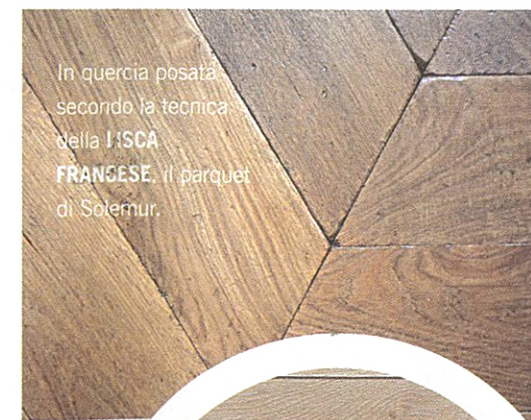
In quercia posata secondo la tecnica della FRANCESE di Sotemur.

• Per ristrutturare travi molto degradate , invece, prima di intervenire è necessario che un esperto effettui l'analisi degli elementi strutturali, valutandone lo stato di conservazione, e provveda, con l'aiuto di un tecnico, al loro eventuale rinforzo, mediante incravattamento delle travi con cinturazioni metalliche o con l'affiancamento con profilati metallici, oppure, in casi estremi, alla sostituzione degli elementi.